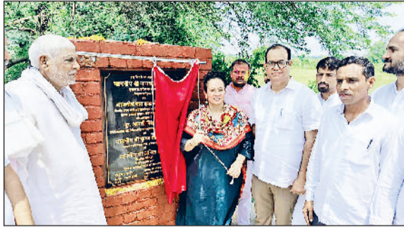
रेवाड़ी। गांव लुखी में उप स्वास्थ्य केंद्र की आधारशिला रखते हुए स्वास्थ्य मंत्री आरती राव। व गांव लुखी में ग्रामीणों को संबोधित करते हुए स्वास्थ्य मंत्री आरती राव।

स्वास्थ्य एवं परिवार कल्याण मंत्री आरती राव ने शुक्रवार को कोसली विधानसभा क्षेत्र के गांव लुखी में 55 लाख की लागत से बनाए जाने वाले उप स्वास्थ्य केंद्र का शिलान्यास किया। गांव के आर्य समाज मंदिर में जनसभा को संबोधित करते हुए स्वास्थ्य मंत्री आरती राव ने कहा कि हरियाणा सरकार मुख्यमंत्री नायब सिंह सैनी के नेतृत्व में बिना किसी पक्षपात के सभी हलकों का चहुंमुखी विकास करा रही है।