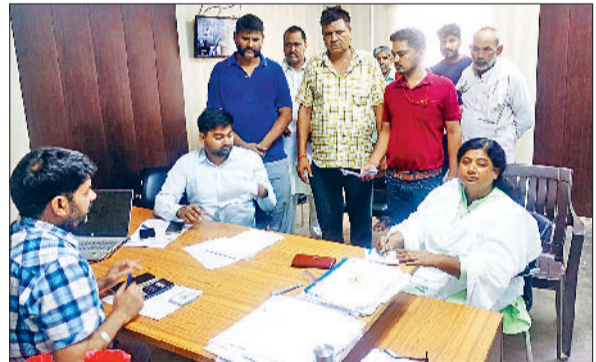
रेवाड़ी। सीआरएफ की मीटिंग में उपभोक्ताओं की समस्या सुनते हुए।

शुक्रवार को बनीपुर चौक बावल स्थित बिजली वितरण निगम के सब अर्बन डिवीजन कार्यालय में उपभोक्ता शिकायत निवारण फोरम यानि सीआरएफ की बैठक आयोजित की गई। बिजली निगम के एक्सईएन ओमेश्वर चैयरेमन के नेतृत्व में मोठड़ा, पाली व बावल की संयुक्त बैठक हुई। बैठक में उपभोक्ताओं की बिजली संबंधित शिकायतें सुनी गईं। एक्सईएन ने बताया कि कंज्यूमर कोर्ट में 50000 तक के बिल समाधान किया जाता है, यदि समस्या ठीक है और किसी उपभोक्ता की शिकायत है तो मौके पर ही समाधान किया जाता है। उन्होंने बताया कि वैसे इस समस्या को समाधान 45 दिन के अंदर होता है। उन्होंने सीआरएफ मीटिंग