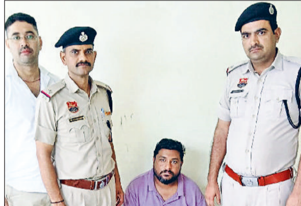
रेवाड़ी। पुलिस गिरफ्त में धोखाधड़ी का आरोपी।

हरिभूमि न्यूज | रेवाड़ी थाना धारूहेड़ा पुलिस ने विदेशी फंडिंग के जरिए अस्पताल खोलने के नाम पर पैसा डबल करने का लालच देकर 50 लाख रुपये की धोखाधड़ी करने के मामले में दूसरे आरोपी को गिरफ्तार किया है। उसे कोर्ट में पेश करने के बाद तीन दिन के रिमांड पर लिया गया है। एक आरोपी को पुलिस पहले ही