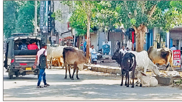
रेवाड़ी। नई अनाजमंडी में लगा गोवंश का जमावड़ा, महाराणा प्रताप चौक के पास बीच सड़क में जमा गोवंश, भाड़ावास रोड पर सड़क पर जमा गोवंश।

लोगों पर हमला करके चोटिल कर चुके हैं। गांवों में मोहल्ला कुतुबपुर में पांच लोगों व सेक्टर-4 में एक युवक पर हमला करके अस्पताल पहुंचा दिया था। इसके बाद शक्ति नगर में लड़ते दो सांडों ने मकान की दिवार तोड़ दी थी। सांडों की इस लड़ाई में स्कूटी सवार एक महिला बाल-बाल बच गई। इससे पहले भी गोवंश दो वर्ष में काफी लोगों को घायल कर चुके हैं तथा दो-तीन लोगों की जान भी ले चुके हैं। शहर के नाईवाली चौक, महाराणा प्रताप चौक, ब्रास मार्केट, मोती चौक,