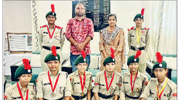
रेवाड़ी। एनसीसी कैडेट्स शिक्षकों के साथ।