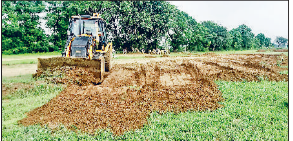
रेवाड़ी। अवैध कॉलोनी पर चलती डीटीपी की जेसीबी।

हरिभूमि न्यूज | रेवाड़ी डीटीपी की टीम ने शुक्रवार को धारूहेड़ा क्षेत्र में नंदरामपुर रोड पर अवैध रूप से विकसित हो रही कॉलोनी में तोड़फोड़ की कार्रवाई