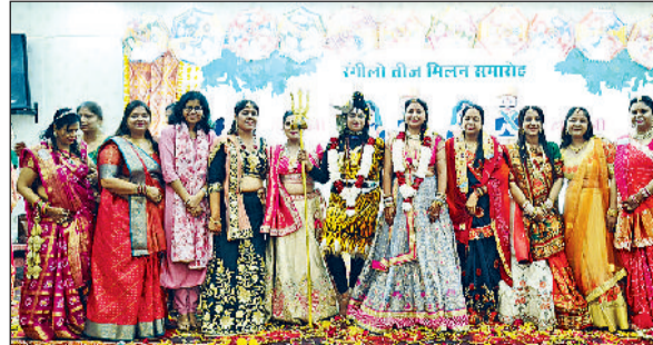
रेवाड़ी। भगवान शिव-पार्वती पर कार्यक्रम पेश करती अग्रवाल समाज की महिलाएं व तीज महोत्सव में मौजूद महिलाएं।