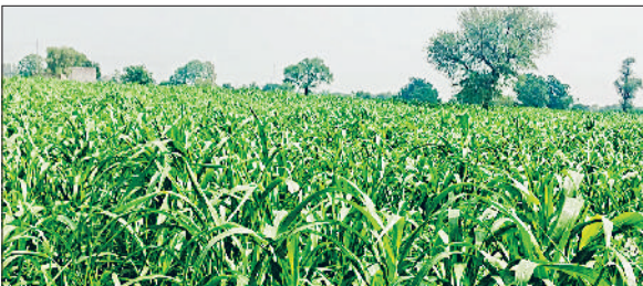
रेवाड़ी। एक खेत में लहसुनी का फसल।

तक मौसम इसी तरह का बना रहने की संभावना है। इस दौरान मध्यम और तेज बरसात भी हो सकती है। शुक्रवार को सुबह से ही आसमान में बादल छाए रहे। सुबह कई इलाकों में हल्की बरसात और बूंदबांदी हुई। इसके बाद तेज धूप खिलते ही उमस भरी गर्मी ने पसीना छुड़ाया शुरू कर दिया। कुछ देर बाद ही आसमान में बादल गहराने के बाद कई इलाकों में हल्की बरसात हुई। अधिकतम तापमान 0.1 डिग्री की मामूली कमी के साथ 31.5 डिग्री सेल्सियस पर