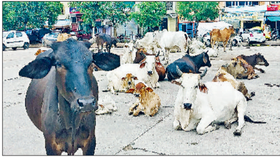
रेवाड़ी। नई अनाजमंडी में लगा गोवंश का जमावड़ा, महाराणा प्रताप चौक के पास बीच सड़क में जमा गोवंश, भाड़ावास रोड पर सड़क पर जमा गोवंश।

प्रशासन की सुस्ती के कारण एक बार फिर शहर की सड़कों पर विचरण करने वाले गोवंश की संख्या बढ़ गई है। गोवंश को पकड़कर गोशालाओं में भेजने का ठेका लेने वाली एजेंसी ने पेमेंट न मिलने के कारण पिछले तीन सप्ताह से अधिक समय से काम बंद किया हुआ है, जिसके कारण शहर के कई मार्गों पर गोवंश का जमावड़ा लगा हुआ है। सड़कों पर घूमते गोवंश पिछले एक महीने में आधा दर्जन से अधिक लोगों को अपना शिकार बनाकर घायल कर चुके हैं। शहर की सड़कों पर घूमती ज्यदातार गाय-गोलालों की है, जिन्हें दूध निकालने के बाद सड़कों पर पेट भरने के लिए छोड़ दिया जाता है, जिसके बाद ये गोवंश हिंसक बनकर लोगों को अस्पताल पहुंचाने का काम कर रहे हैं।