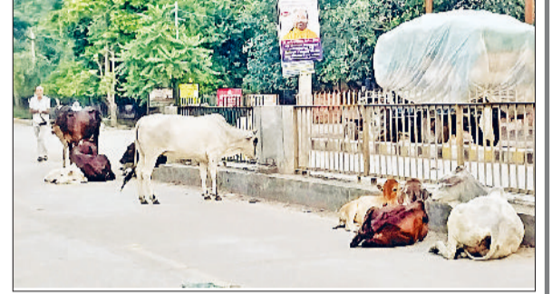
रेवाड़ी। नई अनाजमंडी में लगा गोवंश का जमावड़ा, महाराणा प्रताप चौक के पास बीच सड़क में जमा गोवंश, भाड़ावास रोड पर सड़क पर जमा गोवंश।